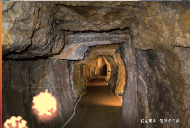
石見銀山 龍源寺問歩