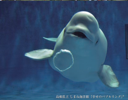
島根県立しまね海洋館「幸せのパブルリング」*